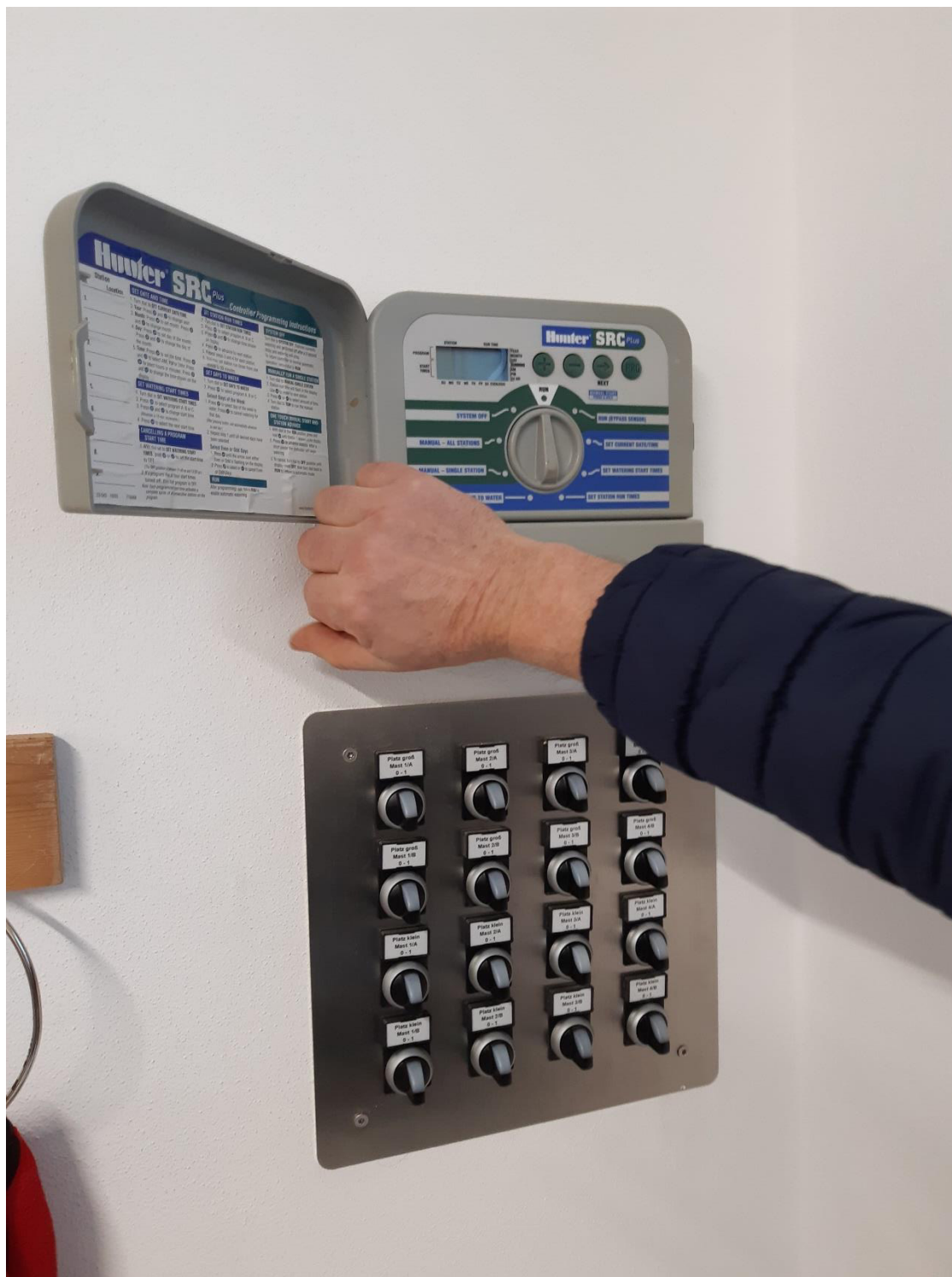
Foto 8: Steuerung Beregnung und Beleuchtung / sistema di controllo irrigazione e illuminazione